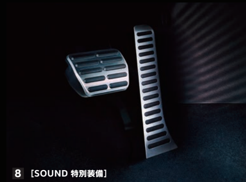
8 [SOUND 特別装備]