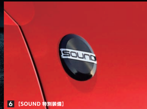
6 [SOUND 特別装備]