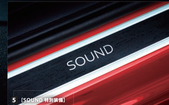
5 [SOUND 特別装備]