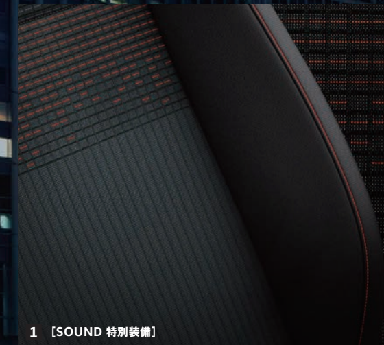
1 [SOUND 特別装備]