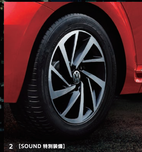
2 [SOUND 特別装備]