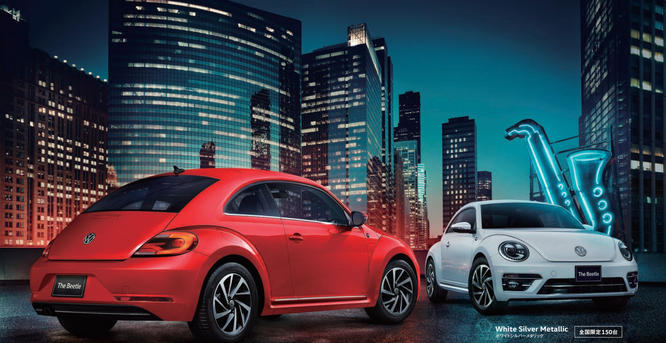
Tornado Red トルネードレッド 全国限定150台