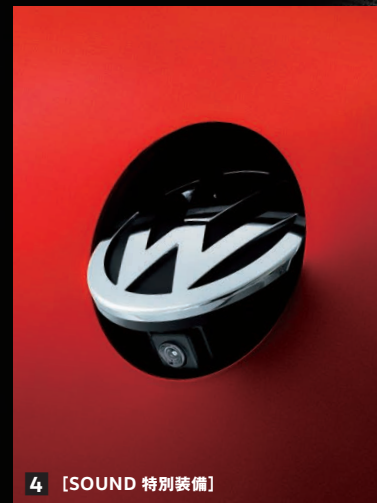
4 [SOUND 特別装備]